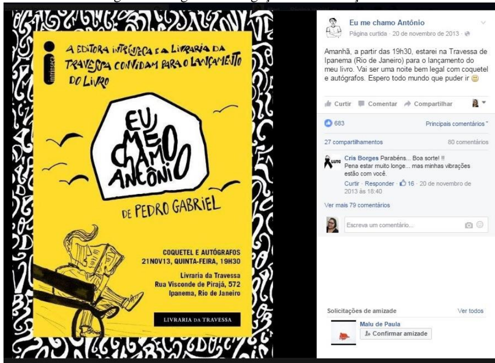
Figura 4 – Segunda divulgação sobre o lançamento