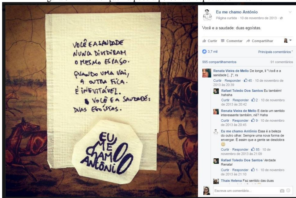
Figura 3 – Intervenção na poesia pelos fãs/resposta do Antonio

Após alguns dias verifica-se a postagem da Figura 3, em que o autor não aborda o assunto do lançamento do livro, apenas apresenta uma foto do guardanapo com a ilustração da poesia, mas há um dado interessante: fãs comentam sobre uma leitura diferente da poesia, e o autor responde ao comentário. Aqui também se notam duas informações importantes: o número de curtidas da foto aumentou significativamente em relação ao da Figura 2 (3,7 mil curtidas) e a interação entre autor e leitores, que indica proximidade. Nesse caso, é possível verificar que a postagem da poesia é bem mais atrativa ao leitor/neousuário do que uma postagem publicitária, divulgando o lançamento do livro (Figura 2).