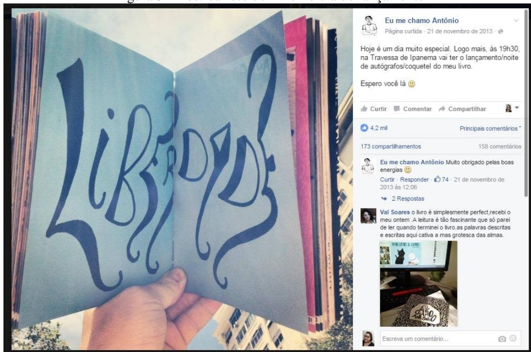
Figura 5 – Post da foto do livro no dia do lançamento