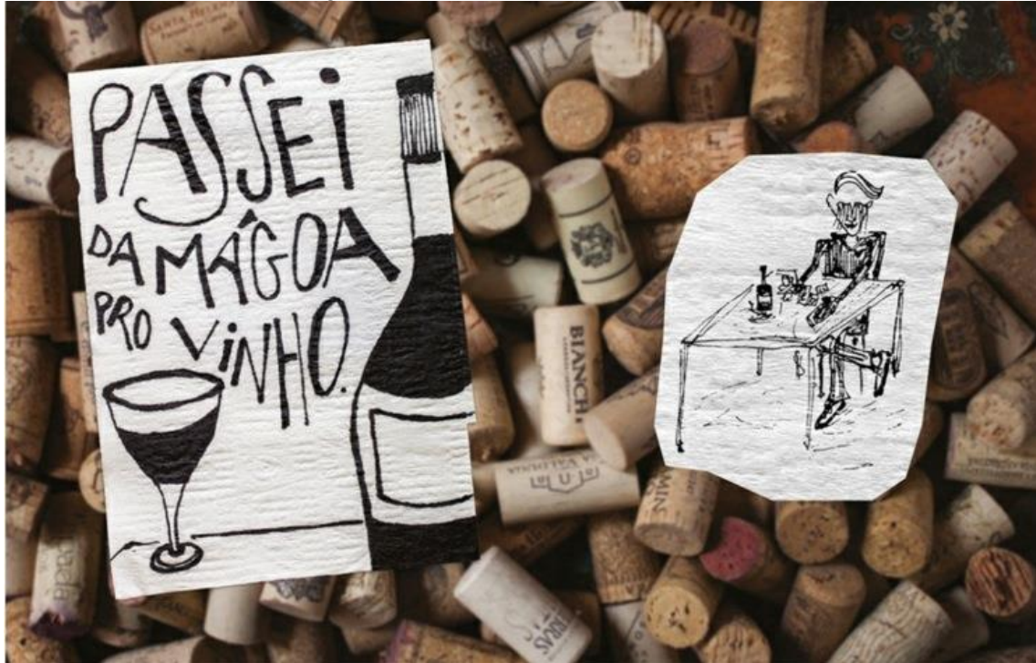
Figura 1 – Eu me chamo Antonio (Livro)