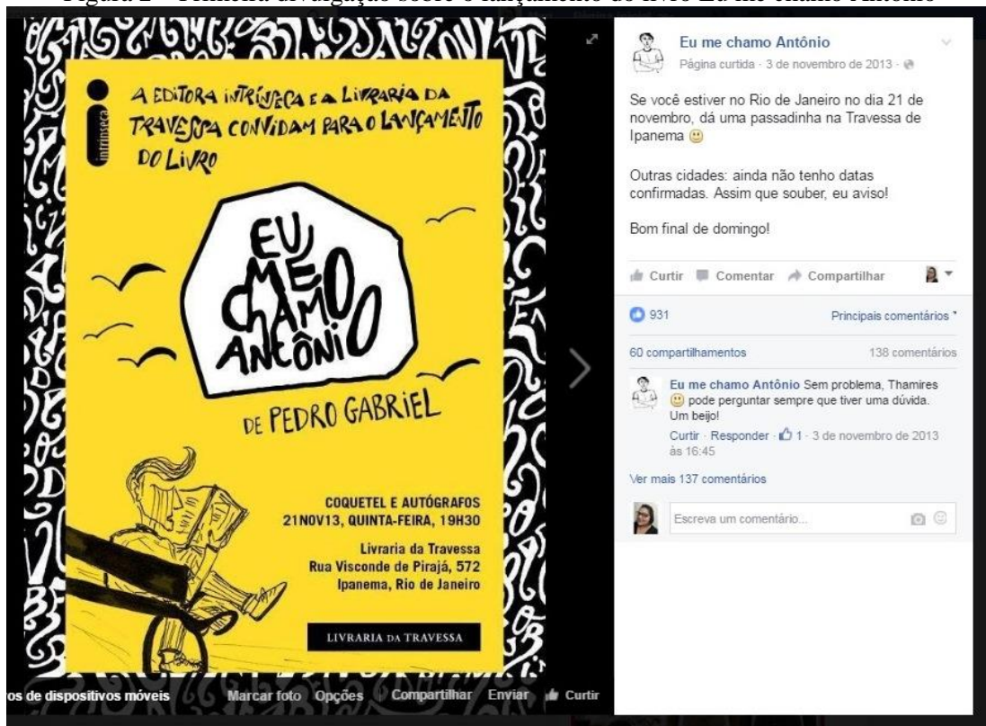
Figura 2 – Primeira divulgação sobre o lançamento do livro Eu me chamo Antônio

Nesse âmbito, na Figura 2 há a primeira divulgação do lançamento do livro, um flyer da editora Intrínseca, de 3 de novembro de 2013. O lançamento aconteceu em 21 de novembro do mesmo ano.