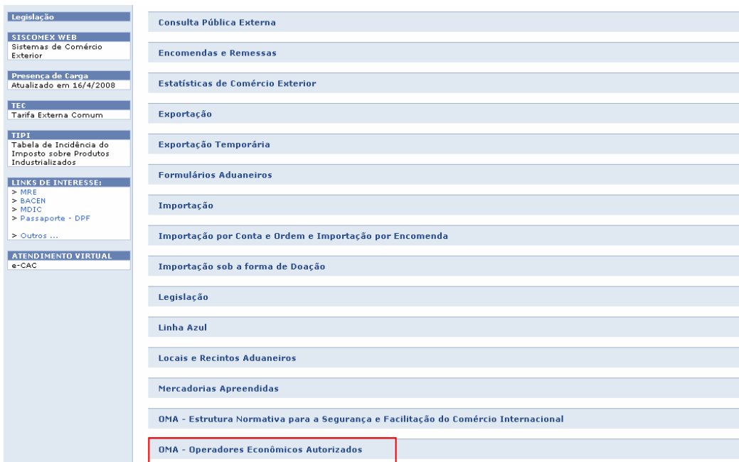
FIGURA 3: Continuação da Tarefa 5, considerada de alto nível de dificuldade, no site da Receita Federal.