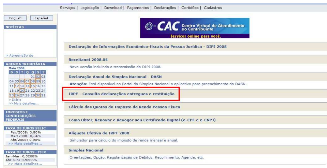
FIGURA 1: Tarefa 1, considerada de baixo nível de dificuldade, no site da Receita Federal.

Todas as tarefas solicitadas foram propostas com base em uma discussão prévia sobre quais seriam os serviços mais comuns a que um usuário ou contribuinte poderia querer ter acesso. Nosso intento era chegar o mais próximo possível das buscas de um leitor real dos sites pesquisados.