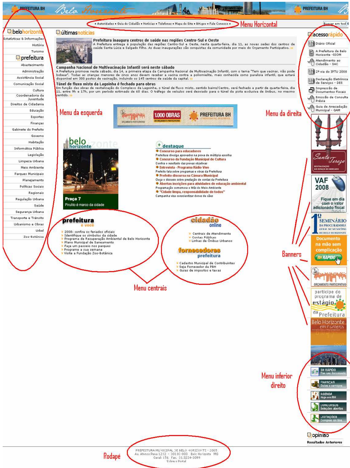
FIGURA 4: Site da Prefeitura de Belo Horizonte com localização de links e menus.