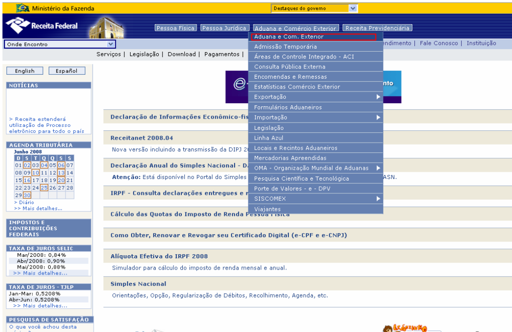
FIGURA 2: Tarefa 5, considerada de alto nível de dificuldade, no site da Receita Federal.